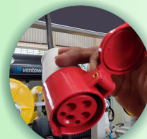
Conector com trava