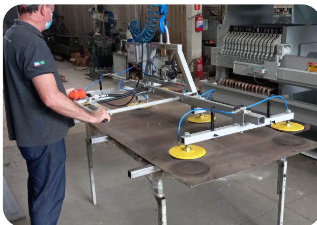
FOTO DE APLICAÇÃO