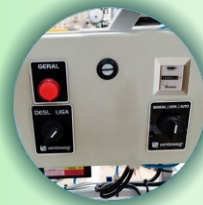
Painel com horímetro