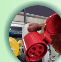
Conector com trava