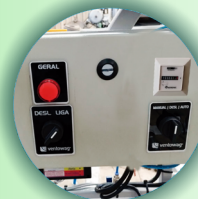
Painel com horímetro