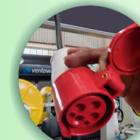
Conector com trava