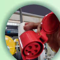
Conector com trava