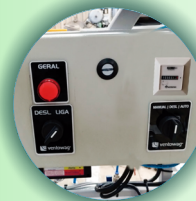
Painel com horímetro