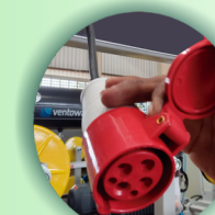
Conector com trava